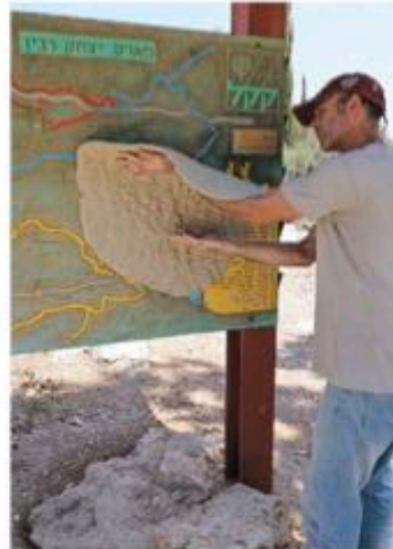
נוה שלום