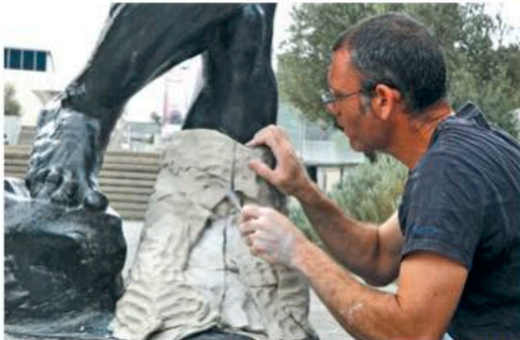
מזיאן ישראל, ירושלים , צילום: שירה ברק